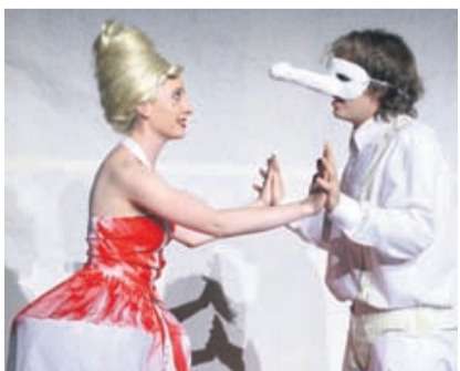
Arkam Asylum - eine der zahlreichen freien studentischen Theatergruppen im Musischen Zentrum

Wer Musik machen will, braucht Instrumente. Keine Probleme hat ein Orchester, wenn es um Streich- oder Blasinstrumente geht: Die bringt ein jeder Musiker selbst mit zu den Proben. Doch ein Flügel, großes Schlagwerk, ein Cembalo, eine Orgel gar – die müssen vor Ort vorhanden sein. Oder kommen nicht vor. So hat der von Hans Jaskulsky geleitete Bereich Musik des Musischen Zentrums zum Beispiel einen Konzertflügel mithilfe der gdf angeschafft. Und auch ein kleines Cembalo wurde mit ihren Mitteln ermöglicht. „Es ist gut trans-