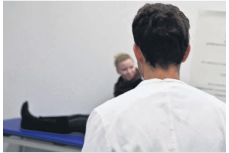
Keine leichte Aufgabe für die zukünftigen Ärzte: das Patientengespräch in schwierigen Situationen. Die Kurse an der RUB wurden von der gdf mit einem Preis ausgezeichnet.