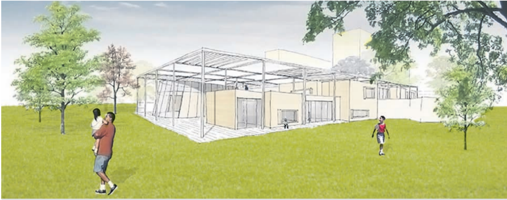
Im Süden der RUB, zwischen Mensa und MA, wird die neue Kita gebaut. Der Blick geht in die Wiege des Ruhrgebiets: Für ein natürliches Umfeld sucht die gdf nach Spendern.