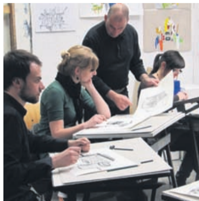
Künstlerischer Umgang mit Stift und Papier - dank der Förderung der gdf kein Problem