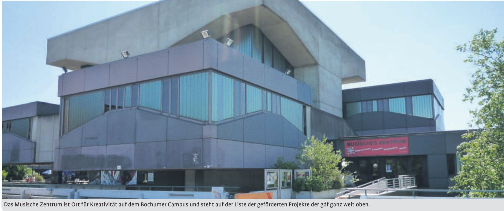
Das Musische Zentrum ist Ort für Kreativität auf dem Bochumer Campus und steht auf der Liste der geförderten Projekte der gdf ganz weit oben.